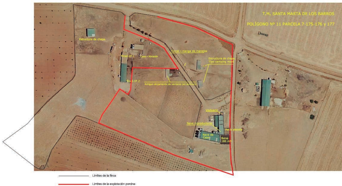
Fig.2. Planta general de las instalaciones vinculadas a la explotación porcina.